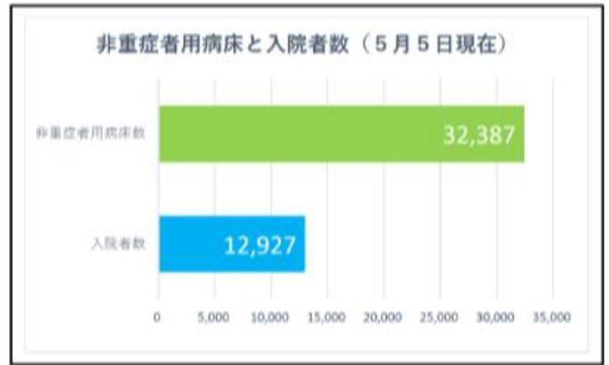
※ NHK特設サイトより 青山まさゆき事務所作成